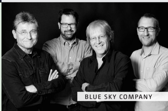
BLUE SKY COMPANY